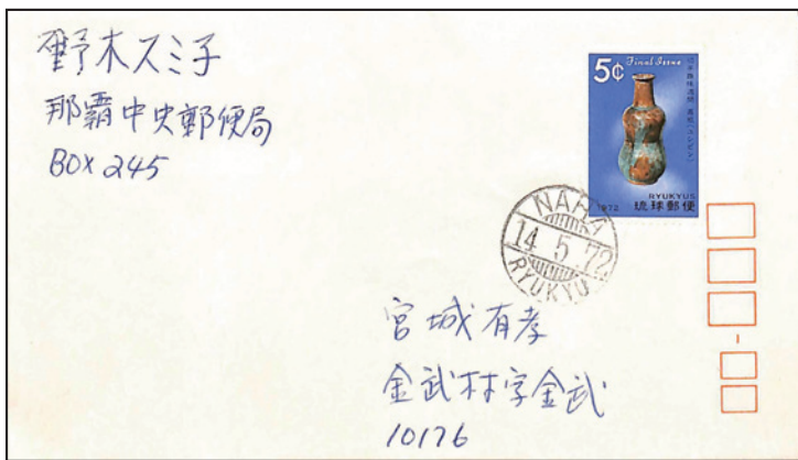
沖縄復帰の約一月前に発行された、最後の沖縄切手「1972年切手趣味週間」

なお、50年前の沖縄返還から半月ほど経過した1972年6月3日をもち沖縄切手は無効となり、現在は使用することができません。